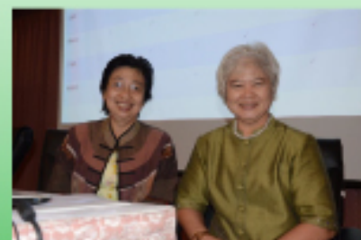
การประชุมวิชาการสัณจร ครั้งที่ 4 จังหวัดสุราษฎร์ธานี วันที่ 25 และ 26 ธันวาคม 2557 จัดวันที่ 26 ธันวาคม 2557 ณ ห้องประชุม รพ.สุราษฎร์ธานี