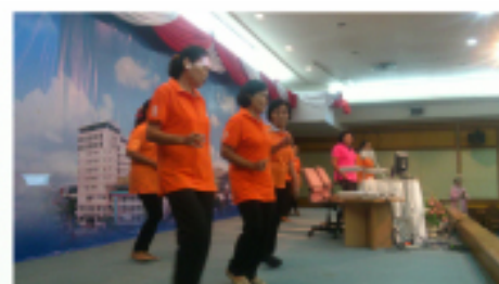
การประชุมวิชาการสัณจร ครั้งที่ 2 วันที่ 1 สิงหาคม 2557 จังหวัดอุบลราชธานี โดยจัดที่ รพ. สรรพสิทธิประสงค์