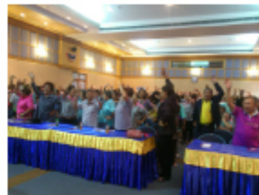
การประชุมวิชาการสัณจร ครั้งที่ 1 วันที่ 14 มีนาคม 2557 จังหวัดชลบุรี โดยจัดที่ อบจ.ชลบุรี