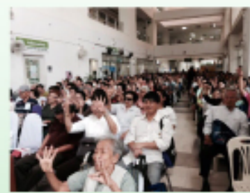
การประชุมวิชาการสัณจร ครั้งที่ 3 วันที่ 1 ตุลาคม 2558 ณ ห้องประชุม รพมหาราชนครเชียงใหม่